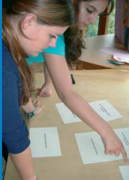
Welche Ziele wollen wir in der Partnerschaft verwirklichen?