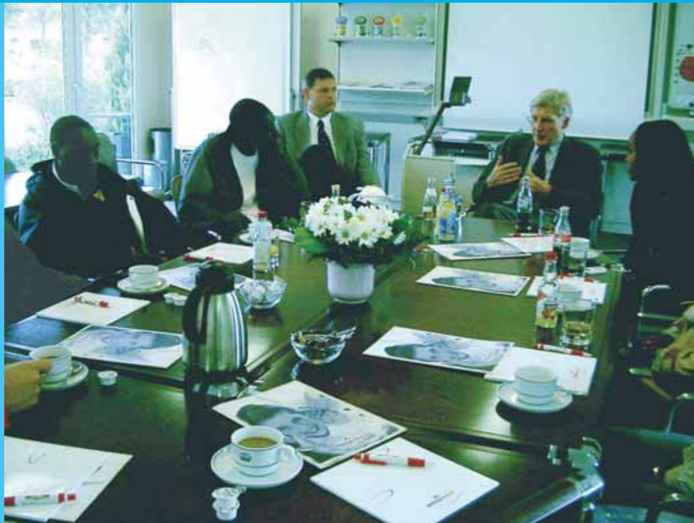
Eine örtliche Firma unterstützt die Partnerschaft

Finanzierungsfragen stellen sich bei Veranstaltungen, Projekten, Reisen und Kommunikationswegen, wie sie bei Baustein 4 und 5 aufgezählt sind. Zu partnerschaftlichen Maßnahmen kann auch gehören, die Schule im Süden materiell und finanziell zu unterstützen. Dabei tauchen allerdings neben den auch für Schulen des Nordens schwierigen Finanzierungsfragen grundsätzliche Probleme auf.