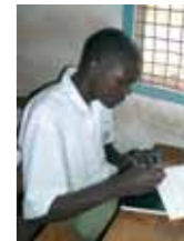
Es geht auch ohne Computer mit einem persönlichen Brief