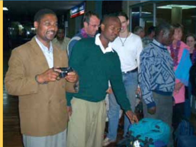
Kontakt mit Menschen anderer Kulturen macht Freude

Schulpartnerschaften mit dem Süden sind ein sehr wertvolles Instrument im Bereich des Globalen Lernens und in der Bildung für nachhaltige Entwicklung. Sie bieten im Rahmen des Lehrplans die Möglichkeit, lebensnah und praxisorientiert wichtiges Wissen über die Lebenssituation in den Ländern des Südens zu vermitteln sowie Denk- und Verhaltensänderungen zu entwickeln. Südpartnerschaften können einen verantwortungs- und respektvollen Umgang mit Ressourcen und Mitmenschen lokal und global bewirken. So werden für jede und jeden Einzelne(n) verschiedene Möglichkeiten der Teilnahme an einer positiven und aktiven Zukunftsgestaltung aufgezeigt. Südpartnerschaften bieten ein Lernfeld für Themen und Querschnittsaufgaben wie Friedens- und Menschenrechtserziehung, Gewaltprävention, Umweltbildung, interkulturelles Lernen sowie entwicklungspolitische und wirtschaftspolitische Bildung. Sie sind ein möglicher Weg weg von der Gebermentalität der Länder des Nordens hin zu einem gleichberechtigten Miteinander, einem voneinander Lernen und einem gegenseitigen Geben und Nehmen. Sie müssen daher lernorientiert gestaltet werden und sollten sich von karitativen Spendenaktionen deutlich darin unterscheiden, dass finanzielle oder technische Hilfeleistungen eingebettet sind in ein gemeinsam ent-