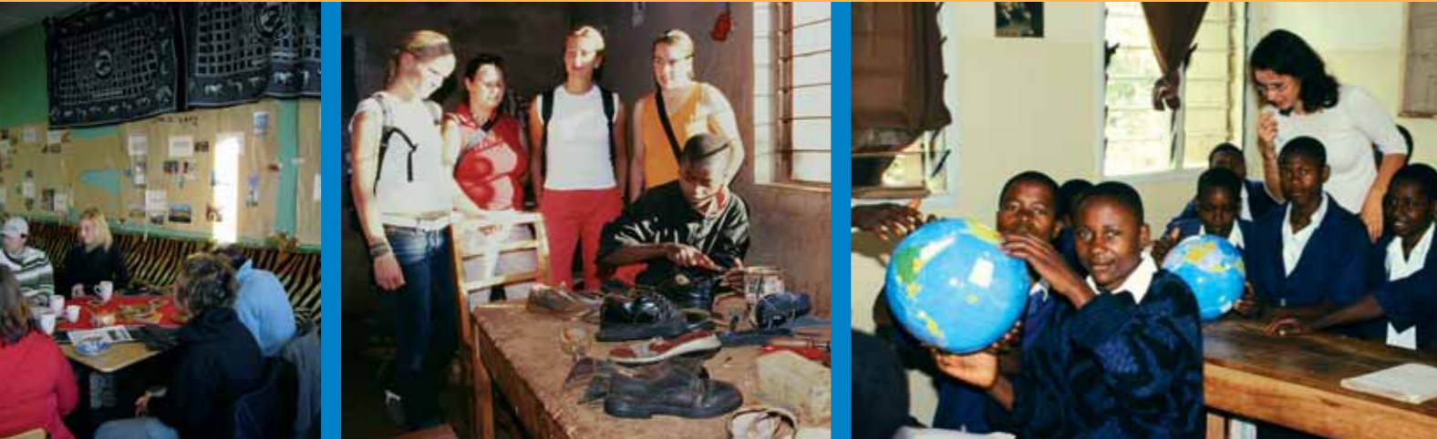
Bild 1 Die Ludwig-Erhard-Schule hat eine Cafeteria eröffnet, in der die Schülerinnen und Schüler auch fair gehandelte Produkte anbieten